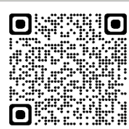
お問い合わせフォーム

(平日 10:00-16:00 ※12:00-13:00 を除く) 対面窓口はありませんので、電話又は右記問合せフォームをご利用ください。