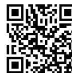
申請者登録フォーム (高効率給湯器)