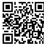
申請者登録フォーム (断熱化改修工事)